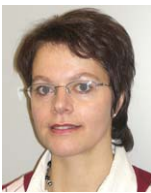
Sekretariat Teilzeit je 20 Stunden Mo, Di Mi, Do, Fr